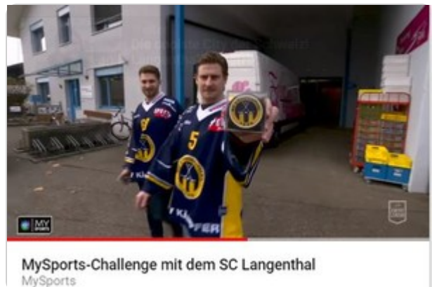
Video: MySports-Challenge mit dem SC Langenthal