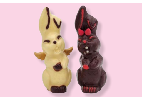
Engelchen & Bengelchen

Engelchen aus weisser Schokolade und Bengelchen aus dunkler Couverture mit Marzipanhörnchen.