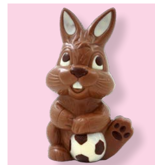
Kind mit Ball

Fröhlicher Osterhase aus feinsten Milkschokolade