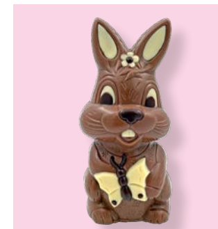
Kind mit Schmetterling

Verspielter Osterhase mit schönen Deko-Elementen.